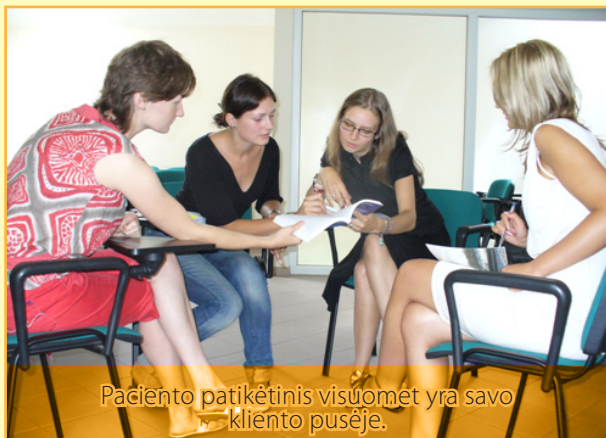
Paciento patikėtinis visuomet yra savo kliento pusėje.

Tokiais atvejais paciento patikėtinis yra kaip tik tas asmuo, kuris padeda pacientui spręsti nepasitenkinimą keliančias situacijas, patenkinti prašymus ir nusiskundimus, susijusius su hospitalizacija, priežiūra, gydymu, slauga ar personalo elgesiu.