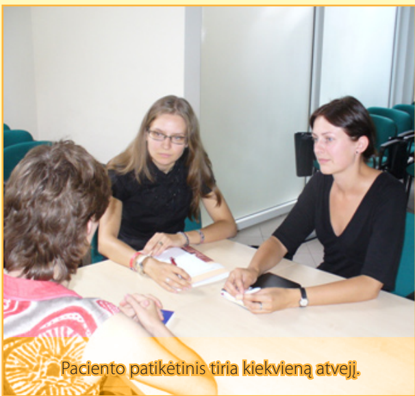
Paciento patikėtinis tiria kiekvieną atvejį.

Paciento patikėtinio paslaugos yra nemokamos, teikiamos visiems VILNIAUS miesto psichikos sveikatos centruose besigydančioms asmenims.